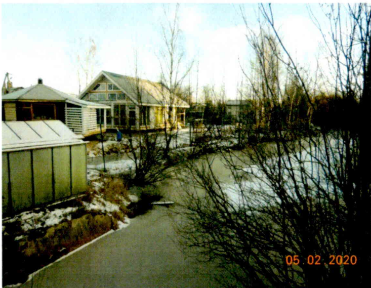
Фото №1. Юго-западная граница земельного участка с кадастровым номером 78:36:1321503:10021