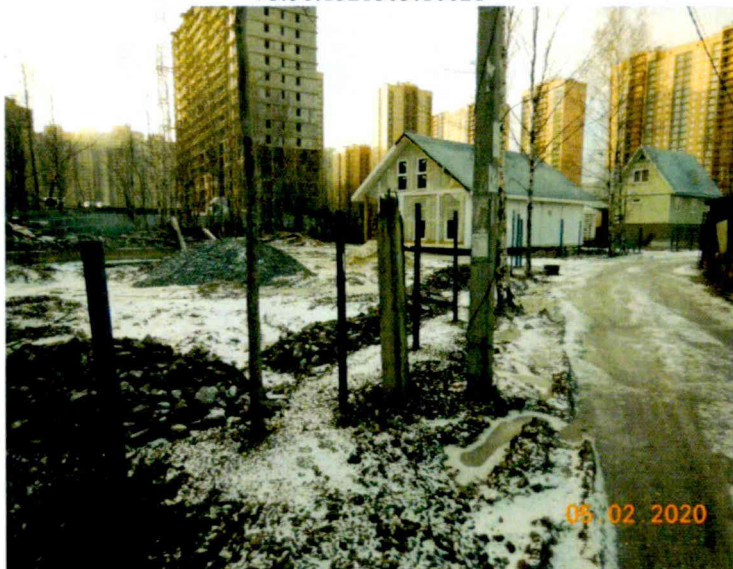
Фото №3. Северо-восточная граница земельного участка с кадастровым номером 78:36:1321503:10021