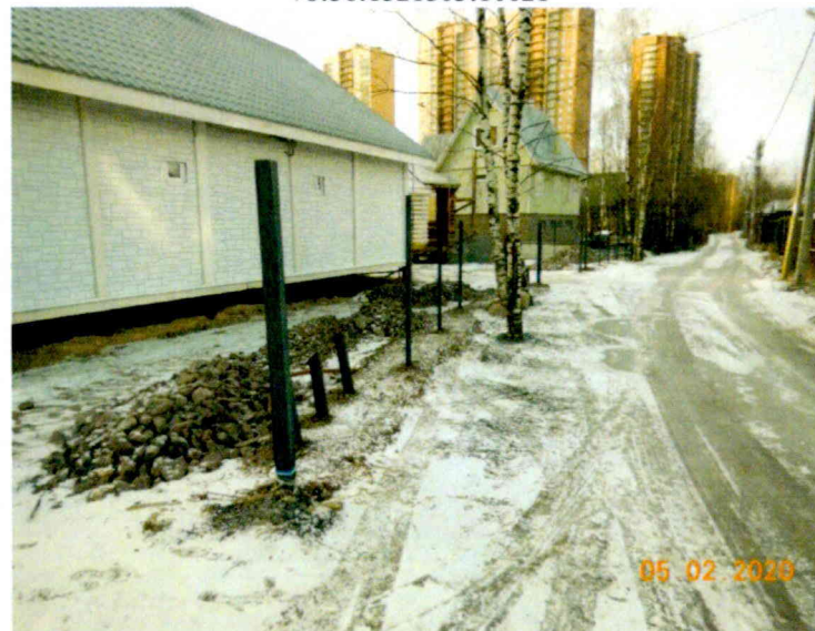
Фото №4. Северо-западная граница земельного участка с кадастровым номером 78:36:1321503:10021