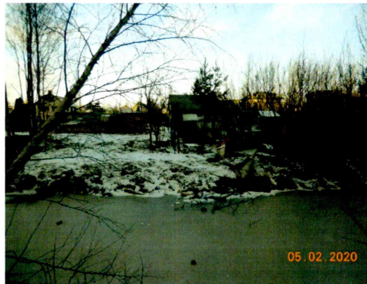
Фото №2. Юго-восточная граница земельного участка с кадастровым номером 78:36:1321503:10021