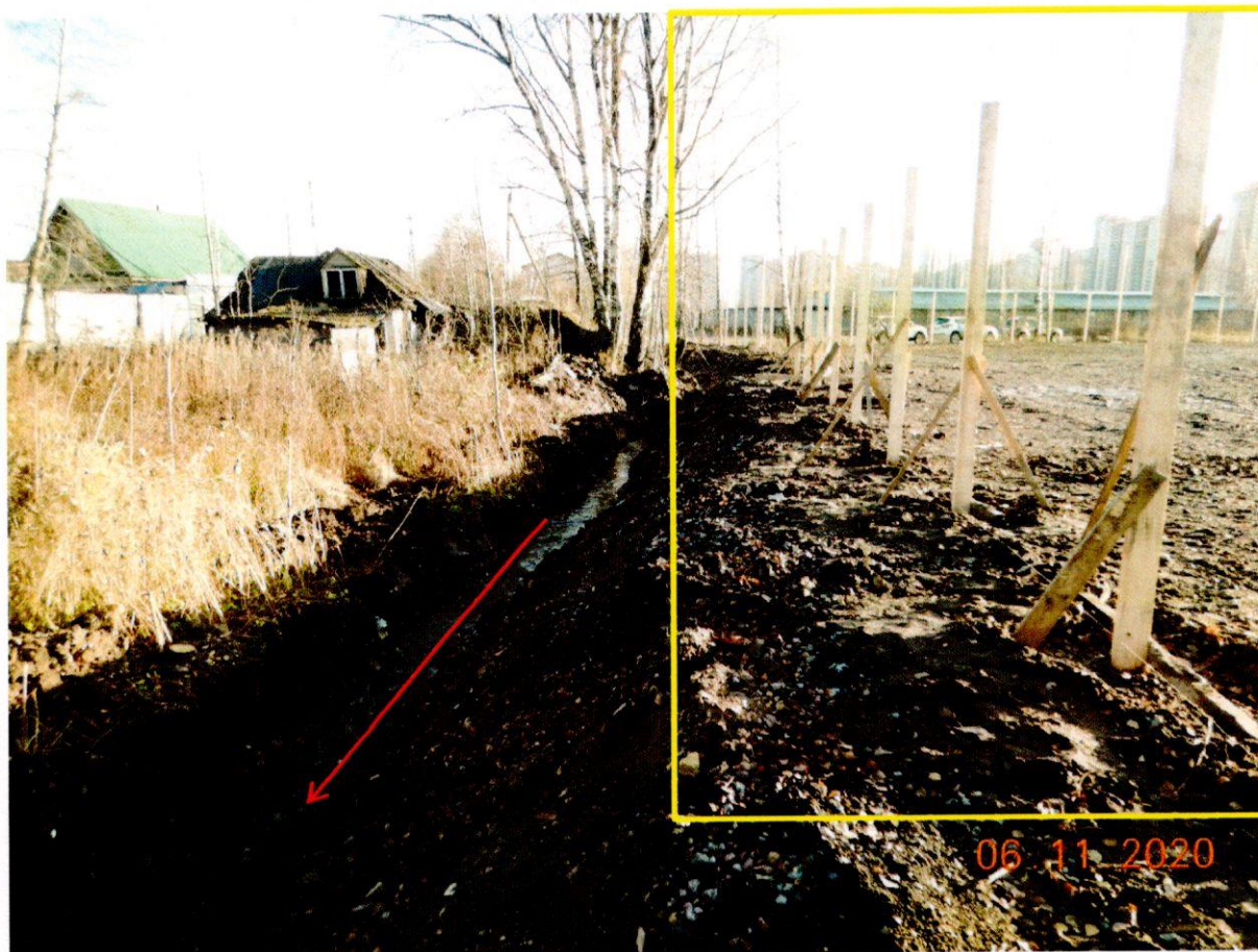
Фото №2. Элемент благоустройства вблизи мелиоративного канала