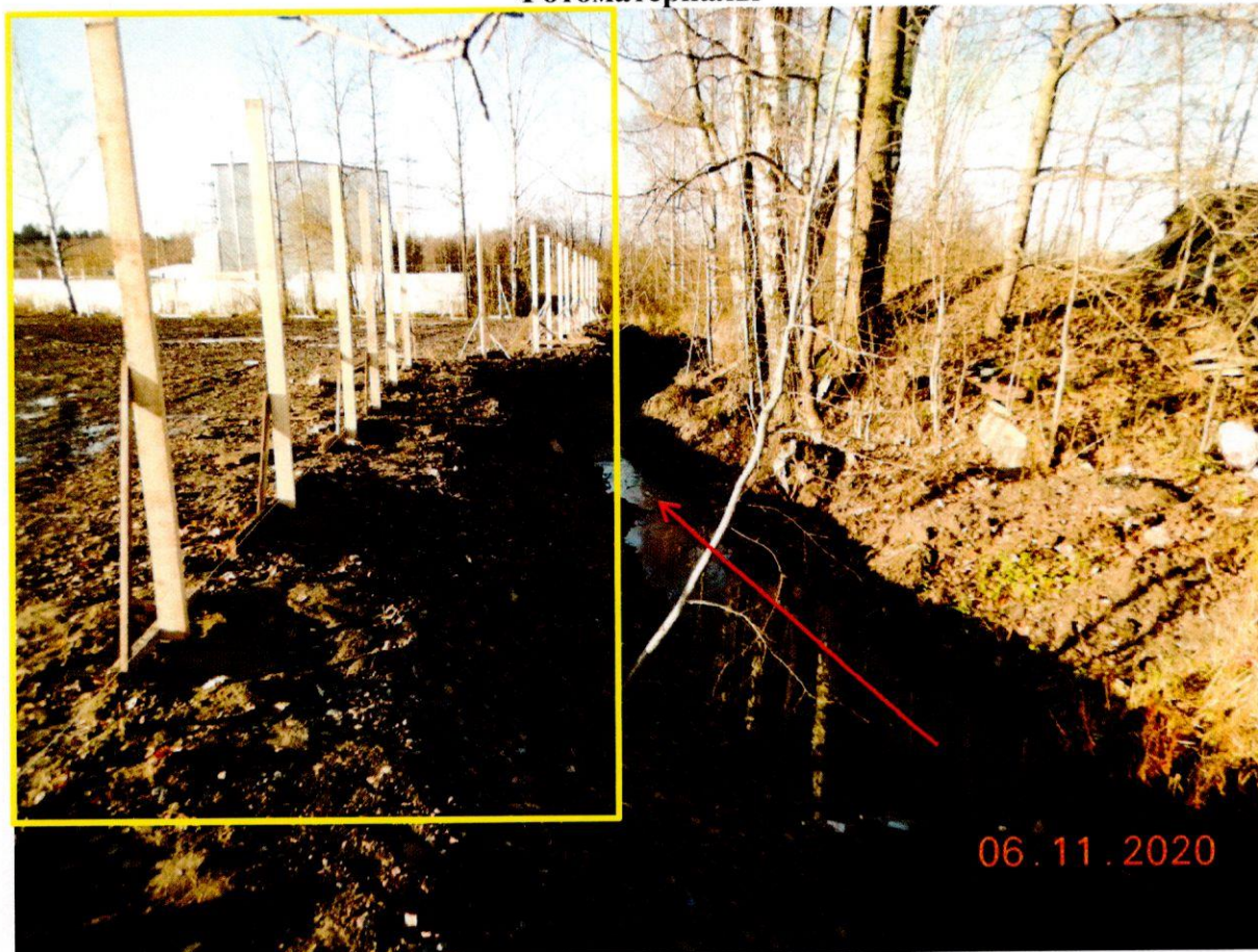
Фото №1. Элемент благоустройства вблизи мелиоративного канала